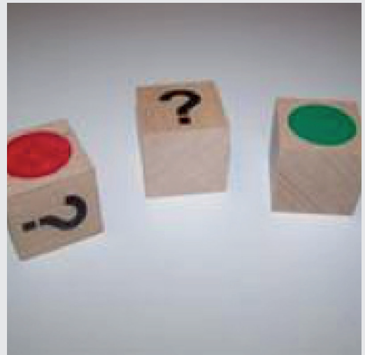
Uitgestelde aandacht pag. 18