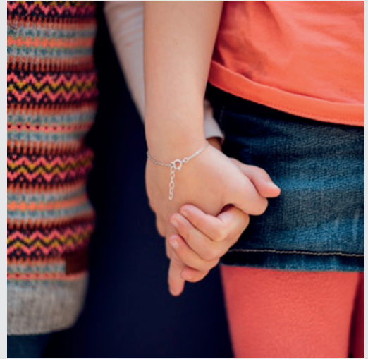
De leerkracht en het team pag. 7